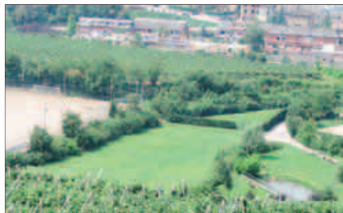
Tra il campo da calcio e il parco è previsto il nuovo nido

Al centro dell'attenzione c'è anche la questione dell'area servizi pubblici, sempre a Martignano. Da sempre il sobborgo soffre per l'assenza di una strut-