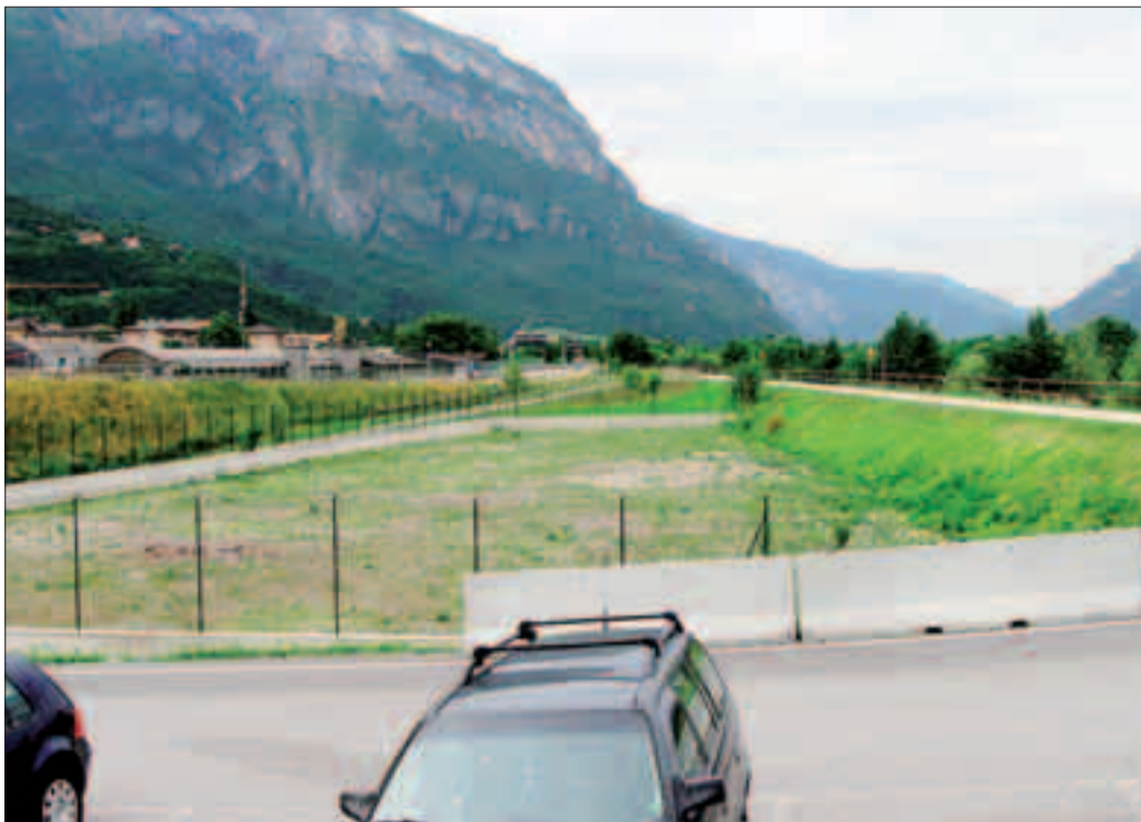
L'area a sinistra della ciclabile dove è prevista la realizzazione del Crn

Possibile? La giustificazione del Comune è questa: il tempo trascorso rispetto al primo progetto definitivo, la diversa localizzazione dell'opera che interessa un'area di superficie maggiore e scelte progettuali completamente riviste per la maggior disponibilità di spazi. Ora infatti il Crn sarà su due livelli con una strada di accesso ai container per il conferimento dei rifiuti da parte dei cittadini e disporrà di una copertura in lamellare a due falde. Per quasi 600 mila euro in più pare il minimo.